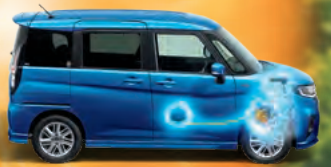
※写真はマイルドハイブリッドのイメージです。

減速時のエネルギーを利用して発電し、専用バッテリーに充電。加速時には、その電力を用いてモーターでエンジンをアシストし、燃料消費を抑制します。