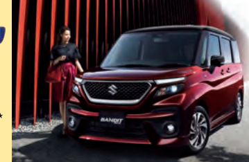
Photo:HYBRID MV 全方位モニター用カメラパッケージ装着車 ボディカラーはメロウディアップルパール ライト2トーンルーフ

●メーカーオプションの全方位モニター用カメラパッケージ55,000円(消費税込み)は価格に含まれておりません。 ●40ワットオーディオシステム プラックアップ仕様44,000円(消費税込み)は価格に含まれておりません。