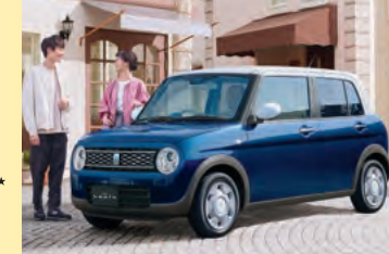
Photo:全方位モニター用カメラパッケージ装着車 ボディカラーはノクターンブルーパール ホワイト2トーンルーフ

●メーカーオプションの全方位モニター用カメラパッケージ52,800円(消費税込み)は価格に含まれておりません。 ●ホワイト2トーンルーフ仕様44,000円(消費税込み)は価格に含まれておりません。