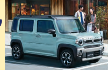
Photo:全方位モニター用カメラパッケージ装着車 ボディカラーはオフブルーメタリック ガンメタリック2トーン

●メーカーオプションの全方位モニター用カメラパッケージ52,800円(消費税込み)は価格に含まれておりません。