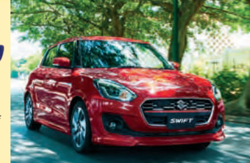
Photo:HYBRID RS 全方位モニター用カメラパッケージ装着車 ボディカラーはパニングレンドパールメタリック

●メーカーオプションの全方位モニター用カメラパッケージ52,800円(消費税込み)は価格に含まれておりません。 ●オートレンドパールメタリック塗装22,000円(消費税込み)は価格に含まれておりません。